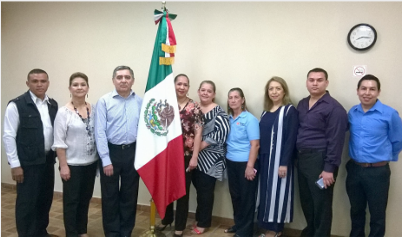
Honores a la Bandera Nacional

Los mexicanos somos un pueblo comprometido con nuestra patria, y su bandera es el símbolo de la unidad nacional. En la Bandera se proyecta todo aquello que nos hace sentir orgullosamente mexicanos. En este sentido, el 24 de febrero, Día de la Bandera, el personal del Consulado de México le rindió honores en compañía de amigos hondureños que estuvieron presentes en ese acto.