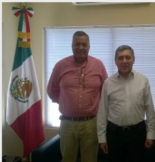
Alcalde Amner Mendoza y Cónsul Omar Hurtado

En el marco de las buenas relaciones que mantiene el Consulado con la Municipalidad de San Antonio de Cortés, el 22 de febrero esa Representación consular recibió la visita del Alcalde Amner Mendoza, con quien se conversó sobre proyectos culturales en la Casa de la Cultura de ese municipio.