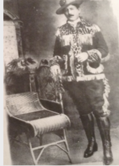
General Héctor Macías

La reacción fue inmediata y las fuerzas gubernamentales aplacaron la intentona del golpe militar, en un contraataque registra-