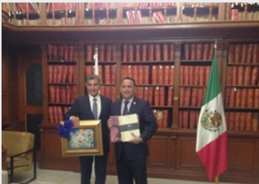
Presidente Municipal de la Heroica Puebla de Zaragoza y Alcalde de San Pedro Sula

Entre los temas a desarrollar se encuentran el intercambio de experiencias en materia de planeación, programación financiera y administrativa, infraestructura urbana, transporte público, desarrollo sostenible y sustentable, temas de patrimonio de la humanidad, programas para adultos de la tercera edad, jóvenes y comunidades multiculturales, así como intercambio cultural y educativo.